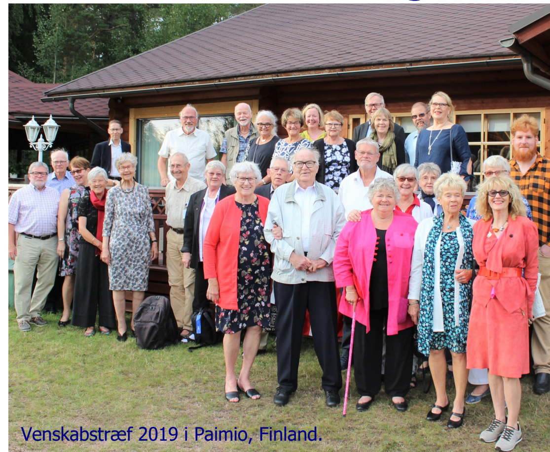
Venskabstræf 2019 i Paimio, Finland.